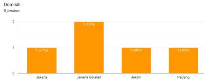
Gambar 1.2 Domosili Peserta Kursus Pra Nikah

Untuk materi pendidikan, mereka sangat puas dengan materi yang diperoleh pada saat mengikuti kursus pranikah yang berlangsung selama 3 bulan tersebut.