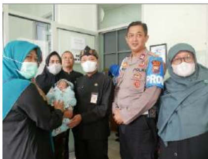
Gambar 1.1 Kasus Bayi Laki-Laki Kota Tegal 2023

RPSAB Wiloso Tomo untuk dirawat atau diasuh sampai bayi tersebut dewasa dan siap diadopsi oleh calon orang tua angkatnya. 8