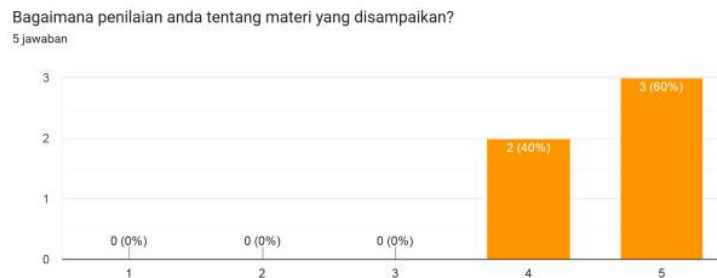
Gambar 1.3 Tingkat Kepuasan Peserta Terhadap Materi Yang Disampaikan

Untuk materi pendidikan, mereka sangat puas dengan materi yang diperoleh pada saat mengikuti kursus pranikah yang berlangsung selama 3 bulan tersebut.