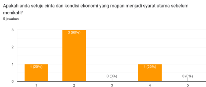
Gambar 1.4 Respon Peserta Terhadap Cinta dan Kondisi Ekonomi Yang Mapan Syarat Utama Menikah

Empat orang responden tidak setuju jika cinta dan kondisi ekonomi yang mapan menjadi syarat utama agar dapat melangkah ke jenjang pernikahan. Sementara satu orang lainnya menyetujui itu.