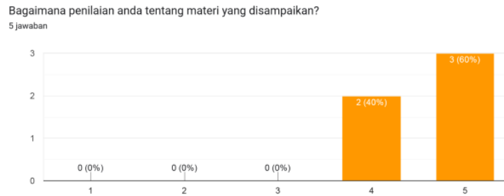
Gambar 1.3 Tingkat Kepuasan Peserta Terhadap Materi Yang Disampaikan

Untuk materi pendidikan, mereka sangat puas dengan materi yang diperoleh pada saat mengikuti kursus pranikah yang berlangsung selama 3 bulan tersebut.